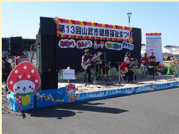
第13回山武市健康福祉まつりの様子