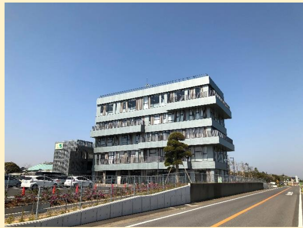
開催場所：山武市蓮沼交流センター