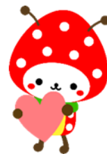
山武市マスコットキャラクター SUNムジくん

主催 山武市ボランティア・市民活動センター 共催 山武市 後援 山武市教育委員会